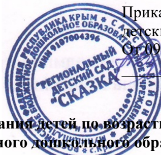
График питания детей, по возрастным группам муниципального бюджетного дошкольного образовательного учреждения «Региональный детский сад «Сказка» села Крымское Сакского района Республики Крым