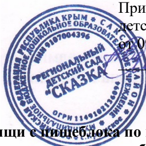
График выдачи пищи с пищеблока по возрастным группам муниципального бюджетного дошкольного образовательного учреждения «Региональный детский сад «Сказка» села Крымское Сакского района Республики Крым