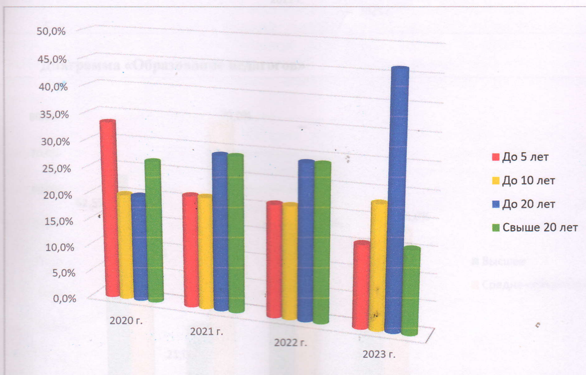
Диаграмма «Категорийность педагогов»